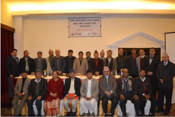
सहभागी र प्रतिष्ठान परिवार

न्यायाधीश, न्याय सेवाका अधिकृतहरू तथा सरोकारवाला व्यक्तिहरूलाई लक्षित गरी मिति २०७२ पौष ४ गते “भ्रष्टाचार नियन्त्रण सम्बन्धी कानूनको प्रभावकारी कार्यान्वयन: समस्या, चुनौती र समाधानका उपायहरू” विषयक कार्यशाला सम्पन्न भयो। उक्त कार्यशालाको मुख्य उद्देश्य भ्रष्टाचार नियन्त्रण सम्बन्धी कानूनको प्रभावकारी कार्यान्वयनका सम्बन्धमा रहेका समस्या र चुनौतीहरूको पहिचान गरी