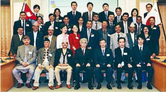
नेपाली अध्ययन टोली जापानी प्रतिनिधिहरूसँग