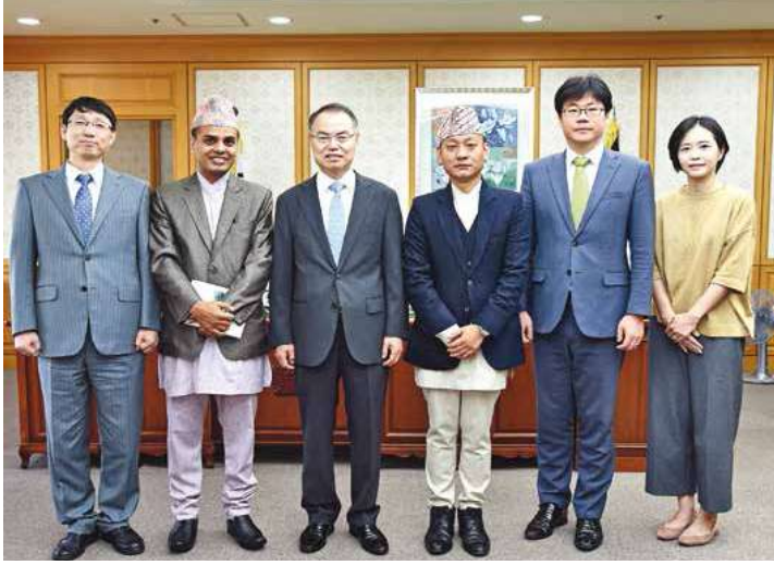
जेआरटिआईका अध्यक्षसँग प्रतिष्ठानका सहभागीहरू

ज. न्यायिक प्रशिक्षण व्यवस्थापन सम्बन्धी प्रशिक्षणमा सहभागिता: प्रतिष्ठानका कर्मचारीको प्रशिक्षण