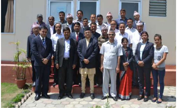
कार्यक्रम संयोजन समूहसँग कार्यक्रमका सहभागीहरु

जिल्ला अदालतको व्यवस्थापन सम्बन्धमा मुख्य जिम्मेवार अधिकृतको रूपमा काम गर्ने श्रेस्तेदारहरुलाई उक्त जिम्मेवारी कुशलतापूर्वक बहन गर्न सक्षम बनाउने यस प्रशिक्षणको प्रमुख उद्देश्य रहेको थियो। कार्यक्रममा नेतृत्व विकासका विविध पक्षहरु, नेतृत्व र व्यवस्थापन बीचको अन्तर, अदालत व्यवस्थापनमा देखिएका समस्या र समाधानका उपायहरु, कर्मचारीमा उत्प्रेरणा एवं