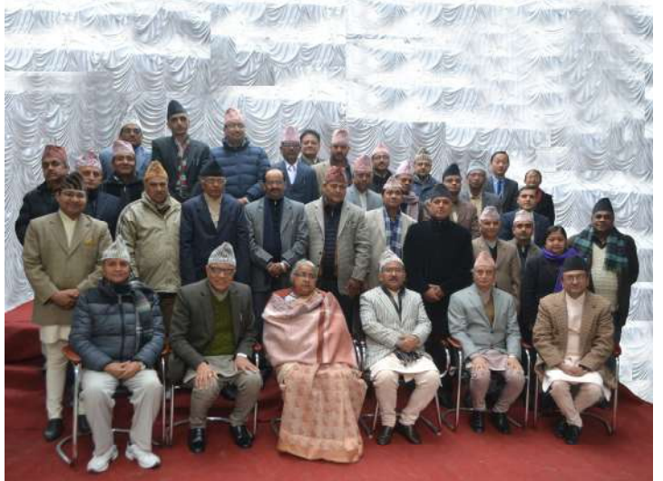
सम्माननीय प्रधानन्यायाधीश श्री कल्याण श्रेष्ठज्यू तथा सर्वोच्च अदालतका माननीय न्यायाधीशज्यूहरूसँग सहभागीहरू

पुनरावेदन तथा जिल्ला अदालतका माननीय न्यायाधीशहरूका लागि मिति २०७२ माघ ७ गतेदेखि ९ गतेसम्म तीन दिवसीय फैसला लेखन परिमार्जन सम्बन्धी कार्यशाला आयोजना गरियो। फैसला लेखन सम्बन्धी अवधारणा, फैसला लेखन सम्बन्धी अन्तर्राष्ट्रिय अभ्यासहरू, फैसला लेखनको भाषा, फैसलाको ढाँचा र संरचनामा सुधारका विषयमा छलफल गर्ने यस कार्यशालाको उद्देश्य रहेको थियो। यस कार्यशालामा सर्वोच्च तथा पुनरावेदन अदालतका माननीय न्यायाधीशहरू तथा पूर्व प्रधान न्यायाधीशहरूले समेत सत्रमा सहजीकरण गर्नु भएको थियो। हरिहरभवन स्थित प्रतिष्ठानको प्रशिक्षण कक्षमा सम्पन्न भएको