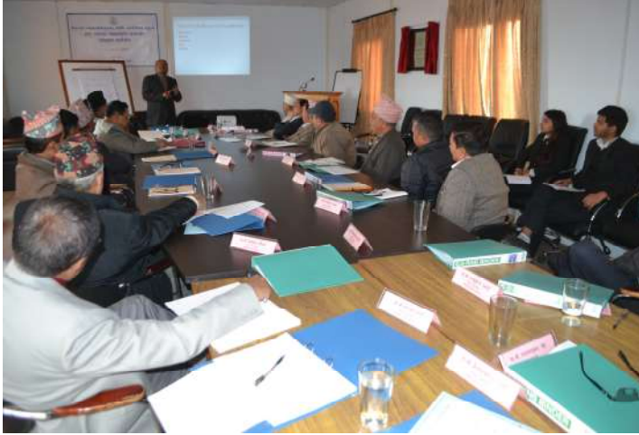
सहभागी माननीय जिल्ला न्यायाधीशहरू अन्तर्क्रियामा

न्यायिक कार्यमा संलग्न जनशक्तिको क्षमता अभिवृद्धिको क्रममा विभिन्न जिल्ला अदालतहरूमा नेतृत्वदायी भूमिका निर्वाह गरिरहनु भएका माननीय जिल्ला न्यायाधीशहरूलाई लक्षित गरी मिति २०७२ माघ ३