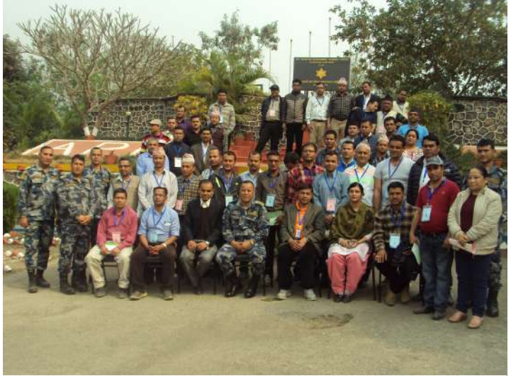
सशस्त्र प्रहरी बल, विपद व्यवस्थापन तालिम केन्द्र कुरिनटार भ्रमणको क्रममा तालिम केन्द्रका पदाधिकारीसँग सहभागीहरू

प्रभावकारी रूपमा सम्पादन एवम् प्रयोग गर्न सहभागीहरूलाई जागरुक बनाई आवश्यक कानूनी लिखत तयार गर्ने सीप विकास गराउने, सहभागीहरूको कार्य क्षेत्रसँग सम्बन्धित पछिल्लो समयमा विकसित न्यायिक दृष्टिकोण र विधिशास्त्रको बारेमा जानकारी गराई न्याय प्रशासन र कार्यालय व्यवस्थापनका लागि आवश्यक पर्ने प्रशासकीय एवम् व्यवस्थापकीय क्षमता विकास गराउने समेत यस सेवाकालीन प्रशिक्षणको उद्देश्य रहेका थिए। प्रशिक्षणको क्रममा सहभागीहरूलाई केन्द्रीय प्रहरी विधि विज्ञान प्रयोगशाला, त्रि.वि. शिक्षण अस्पताल प्रयोगशाला लगायतका अन्य न्यायिक तथा अर्द्धन्यायिक निकायहरूको अवलोकन भ्रमण गराएको थियो। अभियोग लेखन अभ्यास, थुनछेक बहस अभ्यास, बहस अभ्यास जस्ता व्यावहारिक अभ्यास, भूमिका अभिनय लगायत प्रस्तुतीकरण समेत गराइएको थियो। प्रशिक्षणको क्रममा