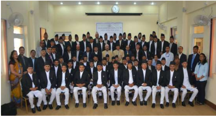
आधारभूत प्रशिक्षण कार्यक्रमका सहभागी नवनियुक्त माननीय न्यायाधीशज्यूहरूको सामूहिक तस्विर

न्याय परिषद्को सिफारिशमा सम्माननीय प्रधान न्यायाधीशज्यूबाट नियुक्त हुनु भएका नवनियुक्त माननीय जिल्ला न्यायाधीशहरूका लागि लक्षित गरी मिति २०७२ भाद्र १ गतेदेखि २०७२ कार्तिक ३० गतेसम्म तीन महिने आधारभूत प्रशिक्षण कार्यक्रम काठमाडौं जिल्ला अदालतको सभाहलमा सम्पन्न भएको थियो। नवनियुक्त ६० जना माननीय जिल्ला न्यायाधीशहरूलाई दुई समूहमा विभाजन गरी प्रशिक्षण सञ्चालन