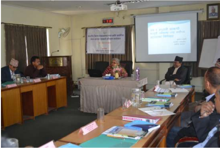
सम्माननीय प्रधान न्यायाधीश श्री सुशीला कार्कीज्यूबाट सहभागीहरूलाई निर्देशन

यस आर्थिक वर्षमा माननीय जिल्ला न्यायाधीशहरूका लागि लक्षित गरी छ, दिवशीय जग्गा प्रशासन सम्बन्धी दुई वटा प्रशिक्षण कार्यक्रमहरू सम्पन्न भए। पहिलो कार्यक्रम मिति २०७२ फागुन १६ गतेदेखि २१ गतेसम्म प्रतिष्ठानको हरिहरभवन स्थित प्रशिक्षण कक्षमा र दोश्रो कार्यक्रम मिति २०७३ बैशाख २७ गतेदेखि जेठ १ गतेसम्म प्रतिष्ठानको मनमैजु स्थित प्रशिक्षण कक्षमा सञ्चालन गरियो। जग्गा प्रशासनसँग सम्बन्धित विषयहरूमा