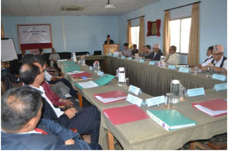
कार्यक्रमको समुद्घाटन सत्रमा सम्बोधन गर्नु हुँदै कार्यकारी निर्देशकज्यू

मिति २०७३ वैशाख १२ गतेदेखि १७ गतेसम्म र २०७३ वैशाख १९ गतेदेखि २४ गतेसम्म गरी दुई समूहमा छ दिवशीय प्रक्रियामा आधारित प्रशिक्षक प्रशिक्षण कार्यक्रम सञ्चालन गरियो। यी दुवै कार्यक्रममा माननीय जिल्ला न्यायाधीश र नेपाल न्याय सेवाका अधिकृतहरूलाई समावेश गरिएको थियो। प्रक्रियामा आधारित यी प्रशिक्षक प्रशिक्षण कार्यक्रमहरूमा वैज्ञानिक प्रशिक्षण पद्धति र वयस्क प्रशिक्षण विधिमा सहभागीहरूलाई जानकारी प्रदान गर्ने, प्रशिक्षण योजना तथा सत्र योजना निर्माण सम्बन्धी सीप सिकाउने, प्रस्तुतीकरण सीप र सहजीकरण सीप अभिवृद्धि गर्ने उद्देश्य रहेको थियो। उक्त उद्देश्य प्राप्तिको लागि प्रशिक्षणको क्रममा प्रशिक्षण व्यवस्थापन, प्रशिक्षण प्रक्रिया र प्रशिक्षकको भूमिका, वयस्क प्रशिक्षण विधि, भूमिका अभिनय, प्रशिक्षण प्रवधिको प्रयोग विधि, प्रस्तुतीकरण सीप जस्ता सैद्धान्तिक तथा व्यावहारिक