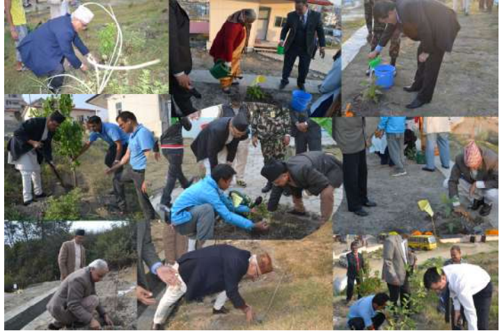
प्रतिष्ठान परिसरमा वृक्षरोपण

यस आर्थिक वर्षमा प्रतिष्ठानको मनमैजु स्थित जग्गामा सम्माननीय प्रधान न्यायाधीश, माननीय कानून मन्त्री, राष्ट्रिय योजना आयोगका माननीय उपाध्यक्ष, सर्वोच्च अदालतका माननीय न्यायाधीश, माननीय महान्यायाधिवक्ता, पुनरावेदन अदालतका माननीय मुख्य न्यायाधीश तथा न्यायाधीश, जिल्ला अदालतका माननीय न्यायाधीश, नेपाल सरकारका विशिष्ट श्रेणीका अधिकृत, कानून व्यवसायी, प्रतिष्ठानका विशिष्ट पाहुना, प्रतिष्ठान