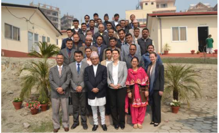
प्रतिष्ठानका कार्यकारी निर्देशक र आईसीआरसीका नेपाल प्रतिनिधिसँग सहभागीहरू

आई.सी.आर.सी. नेपालसँगको सहकार्यमा उपत्यका भित्र कार्यरत जिल्ला न्यायाधीश, अदालतका अधिकृत र सरकारी वकीलहरूका लागि मिति २०७२ चैत्र १२ गतेदेखि १३ गतेसम्म दुई दिवशीय अन्तर्राष्ट्रिय मानवीय कानून विषयक कार्यशाला सम्पन्न भयो। कार्यशालामा अन्तर्राष्ट्रिय मानवीय कानूनको सैद्धान्तिक पक्ष, अन्तर्राष्ट्रिय फौजदारी कानून र अन्तर्राष्ट्रिय मावन अधिकार कानून तथा अन्तर्राष्ट्रिय मानवीय कानूनका