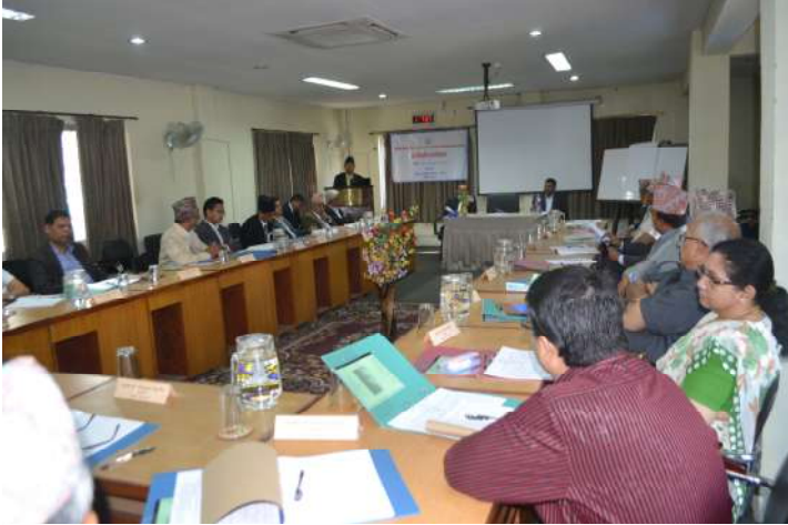
उद्घाटन सत्रमा सम्बोधन गर्नु हुँदै प्रतिष्ठानका कार्यकारी निर्देशकज्यू

वाणिज्य कानूनसँग सम्बद्ध मुद्दा र तिनको प्रकृतिका सम्बन्धमा पुनरावेदन अदालतका माननीय न्यायाधीशहरूलाई लक्षित गरी मिति २०७३ साल वैशाख १२ गतेदेखि १७ गतेसम्म छ दिवसीय कार्यशाला संचालन गरिएको थियो। कार्यक्रममा करार कानून, उद्यम व्यवसाय सम्बन्धी कानून, वैकिङ्ग कानून लगायतका वाणिज्य क्षेत्रका कानूनको प्रकृति र परिवेशका सम्बन्धमा अद्यावधिक गराउने तथा वाणिज्य इजलास