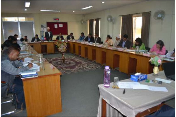
कार्यक्रमका सहभागीहरू अनुभव आदानप्रदान गर्दै

दश वर्षको व्यावसायिक अनुभव भएका कानून व्यवसायीहरूलाई लक्षित गरी मिति २०७२ चैत्र ११ गतेदेखि १३ गतेसम्म तीन दिने विद्युतीय अपराध (Cyber Crime) सम्बन्धी प्रशिक्षण कार्यक्रम सम्पन्न भयो। उक्त प्रशिक्षण कार्यक्रमको मुख्य उद्देश्य सहभागीहरूलाई विद्युतीय अपराध सम्बन्धी जानकारी गराउने, विद्युतीय अपराध सम्बन्धी अनुसन्धान, राष्ट्रिय र अन्तर्राष्ट्रिय कानून र आलेखको जानकारी गराउने, यस सम्बन्धी न्यायिक