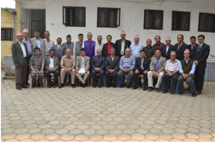
विधिविज्ञानसम्बन्धी दोस्रो प्रशिक्षण कार्यक्रमका सहभागी माननीय जिल्ला न्यायाधीशहरू

माननीय जिल्ला न्यायाधीशहरूका लागि लक्षित गरी छु दिवशीय विधि विज्ञान सम्बन्धी दुई वटा प्रशिक्षण कार्यक्रमहरू क्रमशः मिति २०७२ फागुण ९ गतेदेखि १४ गतेसम्म र २०७३ वैशाख २० गतेदेखि २५ गतेसम्म हरिहरभवन स्थित प्रतिष्ठानको प्रशिक्षण कक्षमा सम्पन्न भए। यी प्रशिक्षणहरूको उद्देश्य माननीय जिल्ला न्यायाधीशहरूलाई विधिविज्ञानको बारेमा परिचित गराई निजहरूको कार्यक्षमतामा प्रभावकारिता