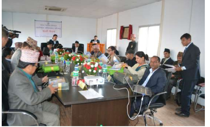
न्यायिक प्रतिष्ठान परिषद्को बाह्रौं बैठक