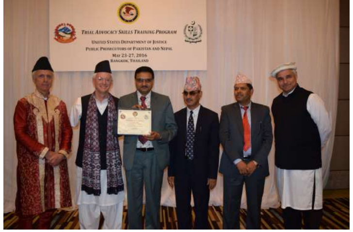
प्रशिक्षकहरूसँग प्रतिष्ठानका फ्याकल्टी माननीय न्यायाधीशज्यूहरु