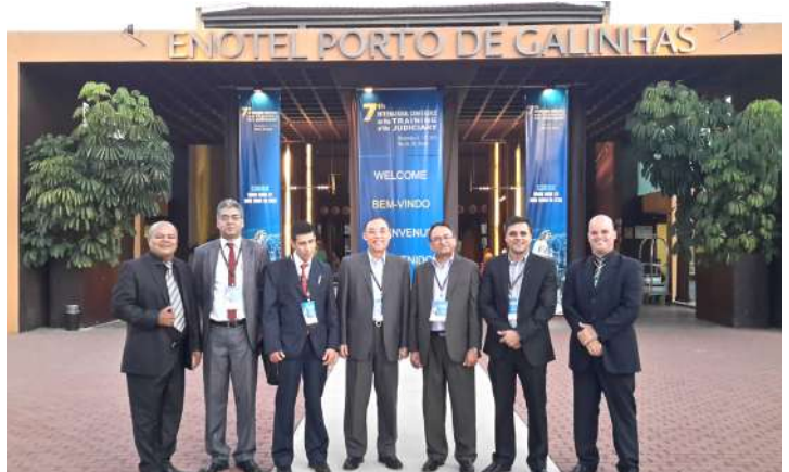
अन्तर्राष्ट्रिय सम्मेलनका सहभागीहरूसँग प्रतिष्ठानको प्रतिनिधि मण्डल

प्रतिष्ठानले स्थापनाको प्रारम्भिक वर्षमा नै न्यायिक प्रशिक्षण प्रदायक संस्थाहरूको अन्तर्राष्ट्रिय संगठनको रूपमा रहेको International Organization for Judicial Training (IOJT) को सदस्यता प्राप्त गरेको भएपनि उक्त संगठनले गत २०१५ नोभेम्बर ८ देखि १२ सम्म ब्राजिलको Recife मा आयोजना गरेका सातौँ International Conference of the Training of Judiciary मा प्रतिष्ठानले औपचारिक रूपमा सहभागिता