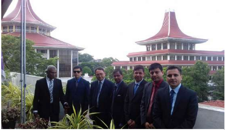
श्रीलंकाको सर्वोच्च अदालत अगाडि अध्ययन टोली

यस आर्थिक वर्षमा प्रतिष्ठानका पदाधिकारी तथा कर्मचारीहरूको टोलीले २०१६ मे २० देखि जुन ५ सम्म श्रीलङ्काको कोलम्बो स्थित न्यायाधीश प्रशिक्षण केन्द्र (Judges Training Institute, Srilanka) लगायत न्यायिक निकायको अध्ययन अवलोकन गर्‍यो। उक्त कार्यक्रमको मुख्य उद्देश्य न्यायिक शिक्षाको सम्बन्धमा श्रीलङ्काको अभ्यास सम्बन्धी जानकारी लिने, न्यायिक प्रतिष्ठानहरू बीचको