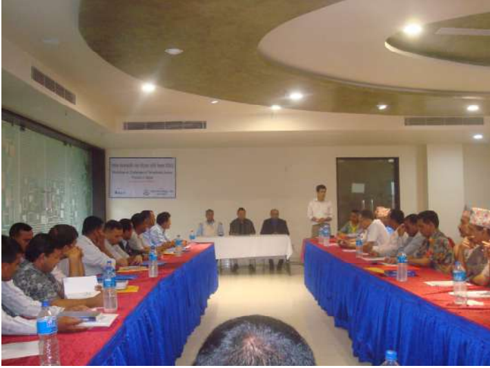
कार्यक्रम उद्घाटन सत्र

न्यायाधीश, अदालतका अधिकृत तथा कर्मचारी, सरकारी वकील, कानून व्यवसायी र प्रहरी अधिकृतहरूलाई लक्षित गरी नेपालमा संक्रमणकालीन न्याय प्रक्रियाका चुनौतीहरू विषयक दुई वटा दुई दिवसीय