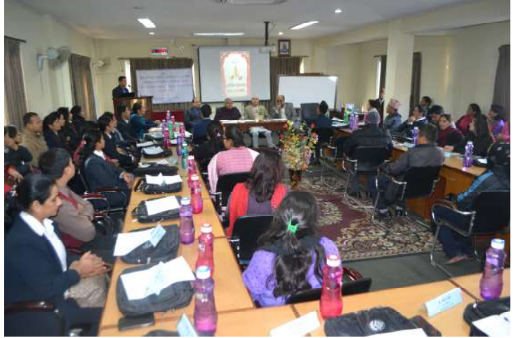
उद्घाटन समारोहका प्रमुख अतिथि सर्वोच्च अदालतका तत्कालीन माननीय न्यायाधीश श्री सुशीला कार्कीजूसँग सहभागीहरू

सामाजिक समावेशीकरणको सन्दर्भमा न्याय सेवा भित्रका लक्षित समूहका अधिकृतहरूको व्यावसायिक दक्षता र प्रतिस्पर्धात्मक क्षमता अभिवृद्धि गराउने मुख्य उद्देश्यले यो कार्यक्रम सञ्चालन गरिएको थियो। यस प्रशिक्षण कार्यक्रममा नेपालको वर्तमान संविधान, मौलिक हक र राज्यका निर्देशक सिद्धान्तहरू, कानूनको शासन, प्रमाण कानून, सूचनाको हक र सार्वजनिक निकायको दायित्व, न्यायपालिकाको