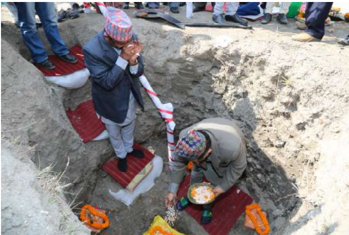
सम्माननीय प्रधान न्यायाधीश श्री कल्याण श्रेष्ठज्यूबाट प्रशिक्षार्थी आवास भवनको शिलान्यास

यस आ. व. मा प्रतिष्ठानको मनमैजु स्थित कार्यालय परिसरमा निर्माण गर्न लागिएको प्रशिक्षार्थी आवास भवनको विस्तृत नक्सा डिजाइन तयार गर्ने, निर्माणाधीन चमेनागृहको निर्माण सम्पन्न गर्ने, चमेनागृह अगाडिदेखि प्रशिक्षण कक्षसम्मको सिढी निर्माण गर्ने, परिसरको सीमानामा तारवार लगाउने लगायतका विभिन्न निर्माण सम्बन्धी कार्यहरू सम्पन्न भएका छन्। निर्माण कार्य र लागतको विवरण अनुसूची ४१ मा समावेश गरिएको छ।