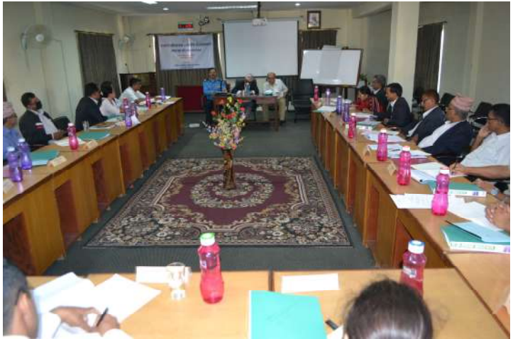
विधिविज्ञान सम्बन्धी प्रशिक्षणका सहभागी सरकारी वकीलहरू सामूहिक छलफल गर्नु हुँदै

महान्यायाधिवक्ताको कार्यालय र यस अन्तर्गतका सरकारी वकील कार्यालयहरूमा कार्यरत सरकारी वकीलहरूका लागि लक्षित गरी मिति २०७२ असोज १० गतेदेखि १५ गतेसम्म छ दिवशीय विधि विज्ञान सम्बन्धी प्रशिक्षण कार्यक्रम प्रतिष्ठानको हरिहरभवन स्थित प्रशिक्षण कक्षमा सम्पन्न भयो। फौजदारी मुद्दामा प्रमाणको वैज्ञानिक परीक्षणको महत्व र वस्तुगत अवस्थाको बारेमा जानकारी गराउने, विशेषज्ञद्वारा पीडित वा अभियुक्तको उमेर