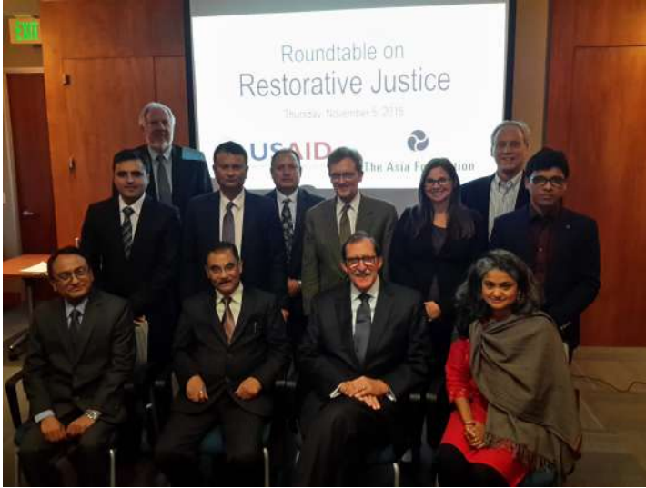
भ्रमणका सहभागी तथा सम्बन्धित संस्थाका प्रतिनिधिहरू

राष्ट्रिय न्यायिक प्रतिष्ठान ऐन, २०६३ ले प्रतिष्ठानद्वारा सञ्चालन हुने प्रशिक्षण कार्यक्रमलाई स्तरीय र प्रभावकारी बनाउन अन्य मुलुकका न्यायिक प्रशिक्षण सम्बन्धी संस्थासँग सम्पर्क राखी सहकार्य गर्ने गरी