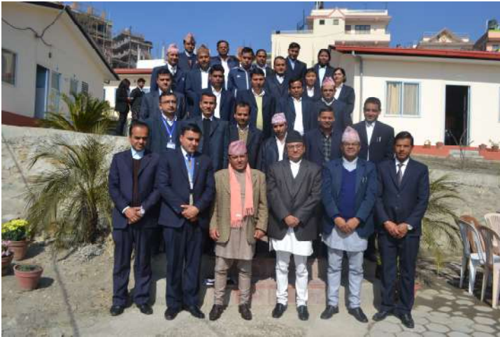
प्रतिष्ठानका कार्यकारी निर्देशक, सर्वोच्च अदालतका रजिष्ट्रार, वरिष्ठतम् नायव महान्यायाधिवक्ता र कार्यक्रम संयोजन समूहसँग सहभागीहरु

(अ) नेपाल न्याय सेवा, सरकारी वकील समूहका राजपत्रांकित तृतीय श्रेणीका अधिकृतहरुका लागि सेवाकालीन प्रशिक्षण कार्यक्रम